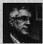
GASPAR LLAMAZARES IU

Es necesario modificar la obsoleta estructura del Servicio de Salud y devolver la gestión propia a la atención primaria. Potenciaremos cada área de Salud con médicos y profesionales, incluyendo las sustituciones de personal. El PP garantizará la libertad de elección de centro y de profesional médico y de enfermería, creando la especialidad de Enfermería de Atención Primaria y Comunitaria.