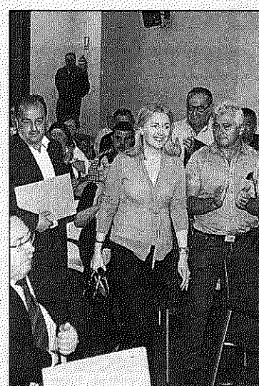
Coto, ayer, en La Felguera.

La atención primaria constituye la parte del sistema sanitario más cercana al ciudadano, por ello, hay que dotarla de los medios necesarios, invirtiendo en sus profesionales y adecuando su presupuesto a sus necesidades reales. Es fundamental racionalizar los servicios de urgencias. Prestar más atención a la atención primaria sería un beneficio para el ciudadano y un ahorro para el sistema.